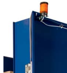
Lystår inkl. max-melder