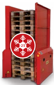
Pallehåndtering i miljøer ned til -25 C°