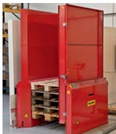
Sikkerhedsoverbygning med luge for 15 paller