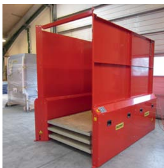
2400x1200x160 mm platforme