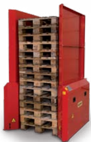
Sikkerhedsoverbygning for 15 paller