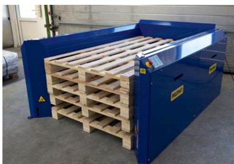
2015x900x137 mm paller

Kontakt din forhandler og lad dem finde PALOMAT® - løsningen til netop dit palleflow