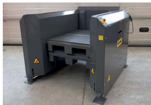
1060x750x175 mm paller

Virksomheder som Grundfos, Carlsberg, Coca Cola, Volvo, Nestlé, Chanel, Haribo, Pfizer, Siemens og Miele bruger allerede PALOMAT® til at effektivisere deres palleflow.